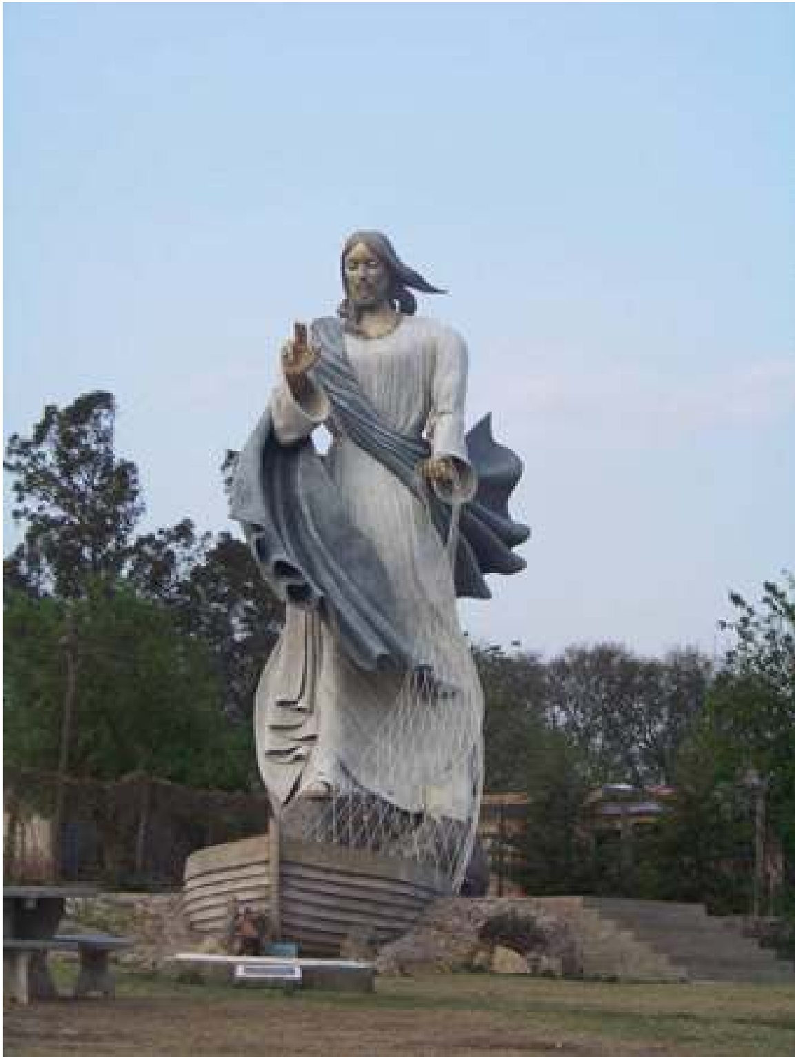
Imagen 1: Cristo Pescador

Rezando la misma canción de la oración del Remanso, se entroniza la imagen de Cristo de los pescadores (Imagen 1). Imagen que acompaña la comunidad del Remanso Valerio pero que en esta experiencia nos acompañará a nosotros.