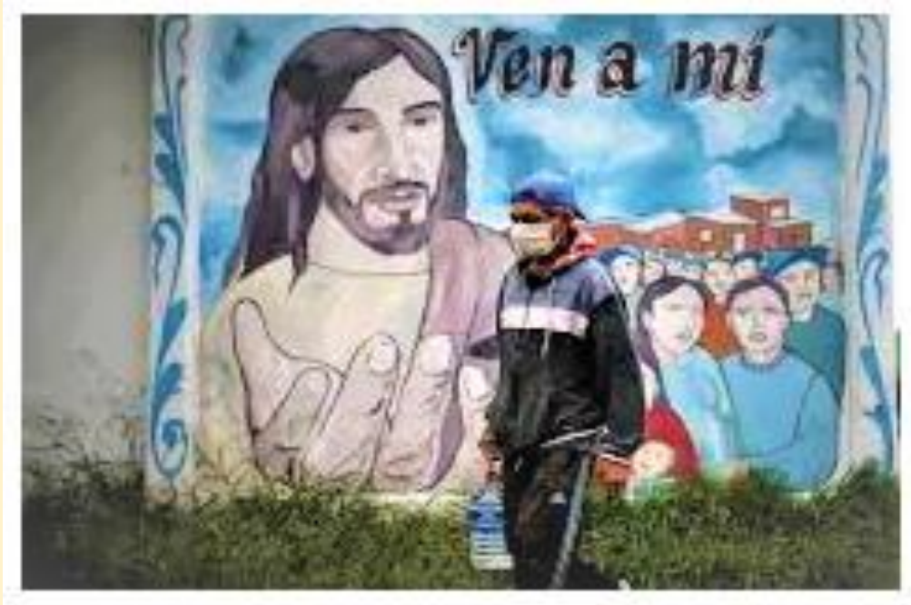
Imagen del mes

Esta imagen del fotógrafo argentino Juan Ignacio Roncoroni (EFE) muestra la escena de la vida cotidiana durante la cuarentena por coronavirus. Cambiaron nuestras rutinas, la forma de comunicarnos, la manera de vivir nuestra fe, las celebraciones litúrgicas. Pero allí seguimos todos, en medio de la pandemia acompañando a nuestro pueblo. Se multiplican las experiencias solidarias y crecen las propuestas para alimentar y crecer en la fe. En este contexto, dice el Papa Francisco, la llamada a la misión, la invitación a salir de nosotros mismos por amor de Dios y del prójimo se presenta como una oportunidad para compartir, servir e interceder.