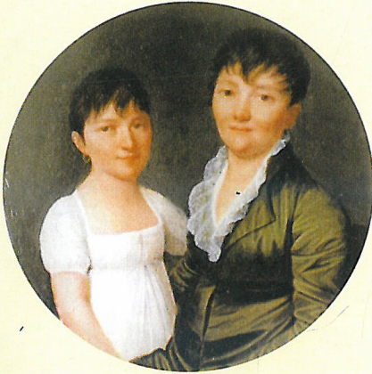
Miniatura de Pauline con su hermana Sofia

Pauline-Marie JARICOT nace en Lión (Francia) el 22 de julio de 1799. Su niñez transcurre en la holgura, con una buena educación cristiana. Inteligente y extrovertida, tan llena de vida , como ella misma reconoce, se convierte en una adolescente envidiada en las fiestas por su belleza juvenil, delicadeza de trato y su refinamiento en el vestir.