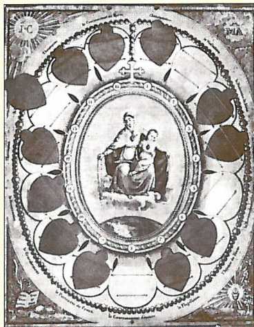
Corona del Rosario Viviente, cada corazón está destinado a recibir el nombre de las quince asociadas.

De esta dolorosa consideración de las realidades de la época en contraste con los ideales sublimes de su corazón, nace en 1826 el nuevo proyecto del ROSARIO VIVIENTE .